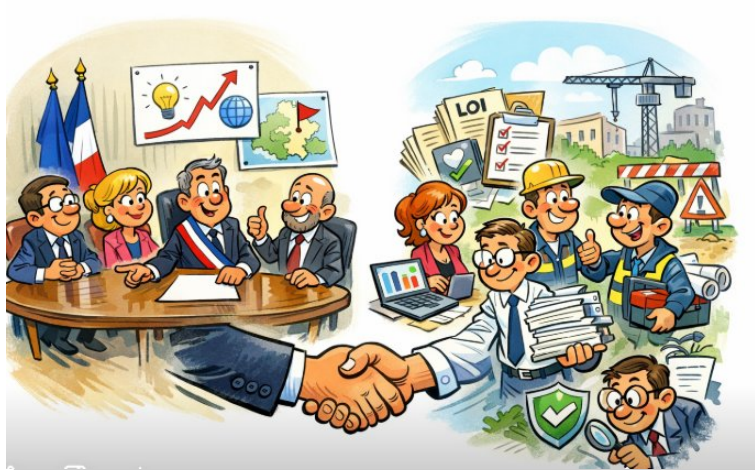
Élus et agents d'Allaire, ensemble au service des habitants

« La ressource humaine est une richesse qui doit être valorisée ; chaque acteur, quel que soit son métier ou ses fonctions, doit pouvoir trouver dans son activité une source d'épanouissement personnel. »