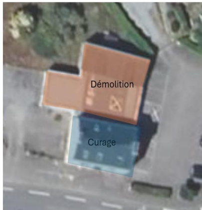
Démolition partielle + curage partiel

Le choix entre ces deux options aura un impact significatif sur le coût et la nature du projet final.